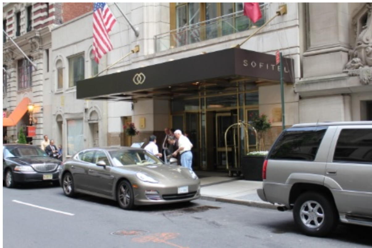
Des mesures pour assurer la sécurité des femmes de chambres à Manhattan

New York (ETATS-UNIS) Après des mois de négociations avec les syndicats, la plupart des grands hôtels de New York viennent ainsi d'accepter de doter leurs femmes de chambre d'un dispositif électronique qu'elles porteront sur elles et leur permettra d'appeler à l'aide.